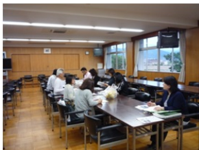
魅力的な紙面にするには.....