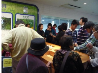
「ホップの香りって……」

次の訪問先の「アサヒビール工場」では麦汁からビールになるまでの工程がわかりやすく説明され、また実際の様子を見て取ることもできました。広大な敷地の工場でしたが、実際に働いている人は50人という数字に、完全に機械化された最先端の工場の一端を見た気がしました。お楽しみの試飲コーナーでは350mlのビールやソフトドリンクを3杯まで飲むことができ、工場でしか味わえない出来立てのビールに舌鼓を打たれていました。その後、工場に併設されているレストランでジンギスカンを堪能しつつ、話に花が咲き、イオンモール今治に移動しました。予定よりも少し遅い時間に着いたため、買い物の時間が短くなり慌しくなりましたが、活気にあふれる今治らしさが感じられるショッピングモールでした。