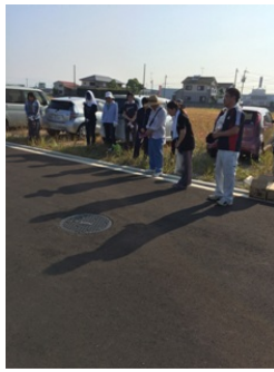
森本生活指導委員長挨拶