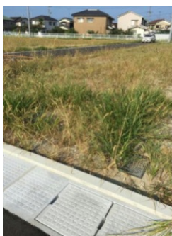
開始直後はこんな感じでしたが・・・

保護者・OB・教職員の総勢81名が結集し、南駐車場は教職員が、NTT松前社宅跡地は保護者とOBが担当して、草刈りに汗を流しました。朝の8時とはいえ、30度近い気温の中、黙々と作業をしていただき、見違えるように、大変きれいになりました。