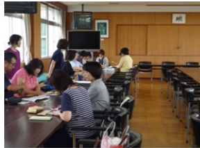
「ポテト1枚、から揚げ1枚」