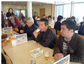
「あー、やっぱりうまい！」