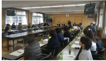
理事会全体の様子

理事会後の懇親会では、3年生理事の皆様にご挨拶の気持ちを伝えました。3年間という長きにわたりPTA活動に携わっていただき、本当にありがとうございました。また、この会に参加できなかった3年生理事の皆様にも、この場を借りてお礼申し上げます。