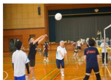
PTA会長も頑張ってます！

さて、各学年2チーム、OBチーム、教職員チームの合計8チームで闘いましたが、8チームの頂点に輝いたのは3年Bチームでした。準優勝は2年Aチーム、意外に景品がゴージャスなブービー賞は2年Bチームでした。日ごろから動き慣れている参加者が多く、暑さをものともしない軽快なフットワーク、朝、顔を合わせただけに円陣を組んで声を出すなど、チームワークのよさがあちこちで見られました。