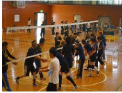
試合の後は互いの健闘を称えあいます。

ソフトバレーを通じて、同じ学校に子供を通わせる保護者同士、また教職員とも親睦が図れた一日だったのではないのでしょうか。お楽しみ品の景品ですが、担当の保健厚生委員会の方々が買い出しに行ってください。現役三役、OBさんたちの御芳志品があり、すごいことになっています。「あらあ、いいわあ」と思われたその会員の皆様、来年にはぜひ御参加をお願いします。お子様が卒業された時には「OBチーム」で御参加ください。