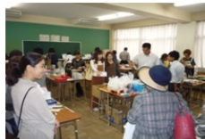
余剰品バザーも大盛況です!