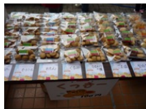
クッキーにもこだわりました。

文化祭バザーは、PTA行事の中でも一番大きなイベントで、たくさんの方のお力で実施できています。6月の役員会でアウトラインを決め、8月の奉仕活動の後で主だった方に集まっていただき、直前の9月10日には大勢の理事さんに集まってもらってこの行事は成立しています。だからこそ、台風が近づいてきている時は青ざめました。皆さんの日ごろの心がけと協力のおかげで台風の打撃も最小限で済みました。