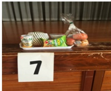
7等 豪華ブービー賞にはメロンがある！

御参加いただきました会員の皆様、お疲れ様でした。皆様のおかげで楽しいひと時を過ごせました。今回、御参加いただけなかった会員の皆様、次回のPTA行事は 8月21日(日)の奉仕活動 です。