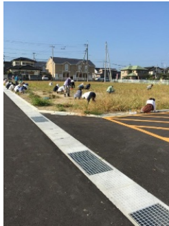
太陽がキラキラ照りつける中、頑張りました。

運動会と文化祭ではNTT松前社宅跡地も駐車場として御利用いただけますが、昨年までのように全面ではありません。跡地の中に舗装道路があるのですが、その道路の西側（国道56号線から奥側）をお借りしていますので御注意ください。運動会は9月7日（水）、文化祭は9月21日（水）を予定しています。保護者の皆様、ぜひお越しいただき、生徒の活躍の様子を御覧ください。お待ちしております。