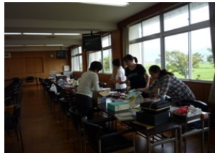
「こっちとそっちを組み合わせたらどうかしら……」