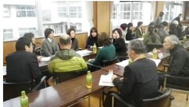
委員会ごとに話し合う様子