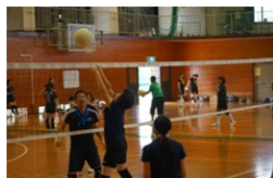
白球を追う真剣なまなざしを見よ！