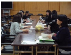
熱心かつ和やかな話し合い

そして、何よりすごいのは15名のメンバーのうち、12名の参加を得たことです。皆さん、お仕事帰りでお疲れのところをわざわざお集まりいただきました。この熱意が伊予高PTAの底力です！