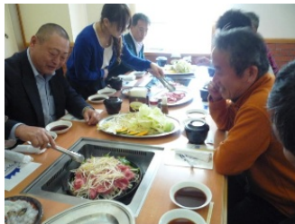
正しいジンギスカンの焼き方です。

今回、東予の3カ所を訪問しましたが、それぞれに趣は違えども、共通するのはどんと新しいものを取り入れて換骨奪胎する姿勢、過去にとらわれず積極果敢に攻めていく精神のような気がしました。愛媛の中の文化や産業を再発見する良い機会になりました。そして、PTA会員相互の研修と親睦が図られたと思います。