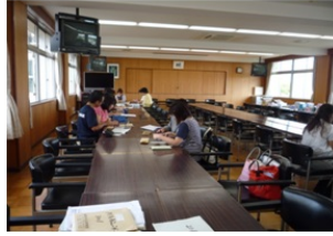
二人一組で確認しながらやっています。

文化祭は9月21日（水）です。この時にもNTT松前社宅跡地を駐車場としてお借りしております。御利用ください。