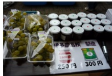
今年の目玉商品、伊予農の特産品!

9月21日(水)に文化祭を実施しました。台風16号の影響を受け、前日の準備ができなかったため、文化祭当日に準備と展示・発表という変則的な実施でしたが、皆さんの力を結集してなんとか間に合わせました。P T A バザーは日ごろ御家庭で鍛えている腕前を發揮し、生徒が一気に押し寄せても大丈夫なお昼の時間に備えました。例年よりは短い時間ではありましたが、用意した食品やら余剰品も見事に売りさばき、片付けも手際よくやっていたできました。