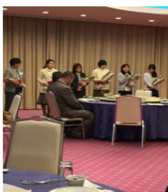
3年理事の皆様、お世話になりました。