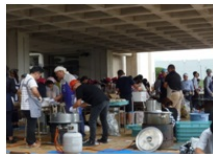
現役の理事だけでなくOBさんも働きます。

文化祭バザーは、PTA行事の中でも一番大きなイベントで、たくさんの方のお力で実施できています。6月の役員会でアウトラインを決め、8月の奉仕活動の後で主だった方に集まっていただき、直前の9月10日には大勢の理事さんに集まってもらってこの行事は成立しています。だからこそ、台風が近づいてきている時は青ざめました。皆さんの日ごろの心がけと協力のおかげで台風の打撃も最小限で済みました。