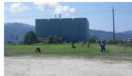
南駐車場 作業風景