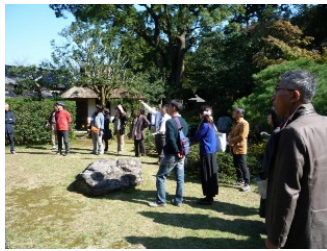
避雷針を見上げる面々「へえーっ」

次の訪問先の「アサヒビール工場」では麦汁からビールになるまでの工程がわかりやすく説明され、また実際の様子を見て取ることもできました。広大な敷地の工場でしたが、実際に働いている人は50人という数字に、完全に機械化された最先端の工場の一端を見た気がしました。お楽しみの試飲コーナーでは350mlのビールやソフトドリンクを3杯まで飲むことができ、工場でしか味わえない出来立てのビールに舌鼓を打たれていました。その後、工場に併設されているレストランでジンギスカンを堪能しつつ、話に花が咲き、イオンモール今治に移動しました。予定よりも少し遅い時間に着いたため、買い物の時間が短くなり慌しくなりましたが、活気にあふれる今治らしさが感じられるショッピングモールでした。