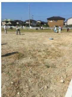
最後は根こそぎきれいになりました。