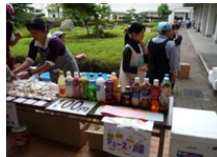
レイアウトも考えました。