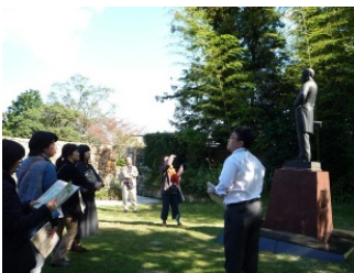
等身大の銅像を前にして