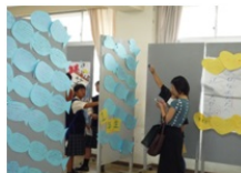
大事な人へのメッセージでは写メする人も。

余剰品の品物の御提供、また御購入、まことにありがとうございました。バザーの収益は後日、お知らせする予定です。収益に関しましてはPTA活動に役立てて参りたいと考えています。 さて、次回のPTA行事は研修旅行です。11月3日(木)に新居浜・西条・今治方面に出かけます。お知らせは近日、配付します。奮って御参加ください。